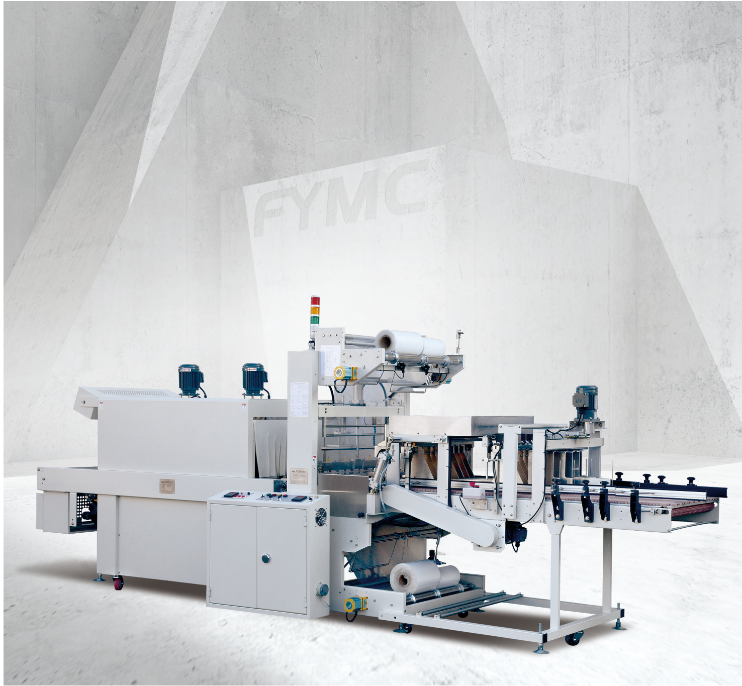
■ 袖筒式兩面封口包裝方式，適用於 150~200 BPM 的產線。