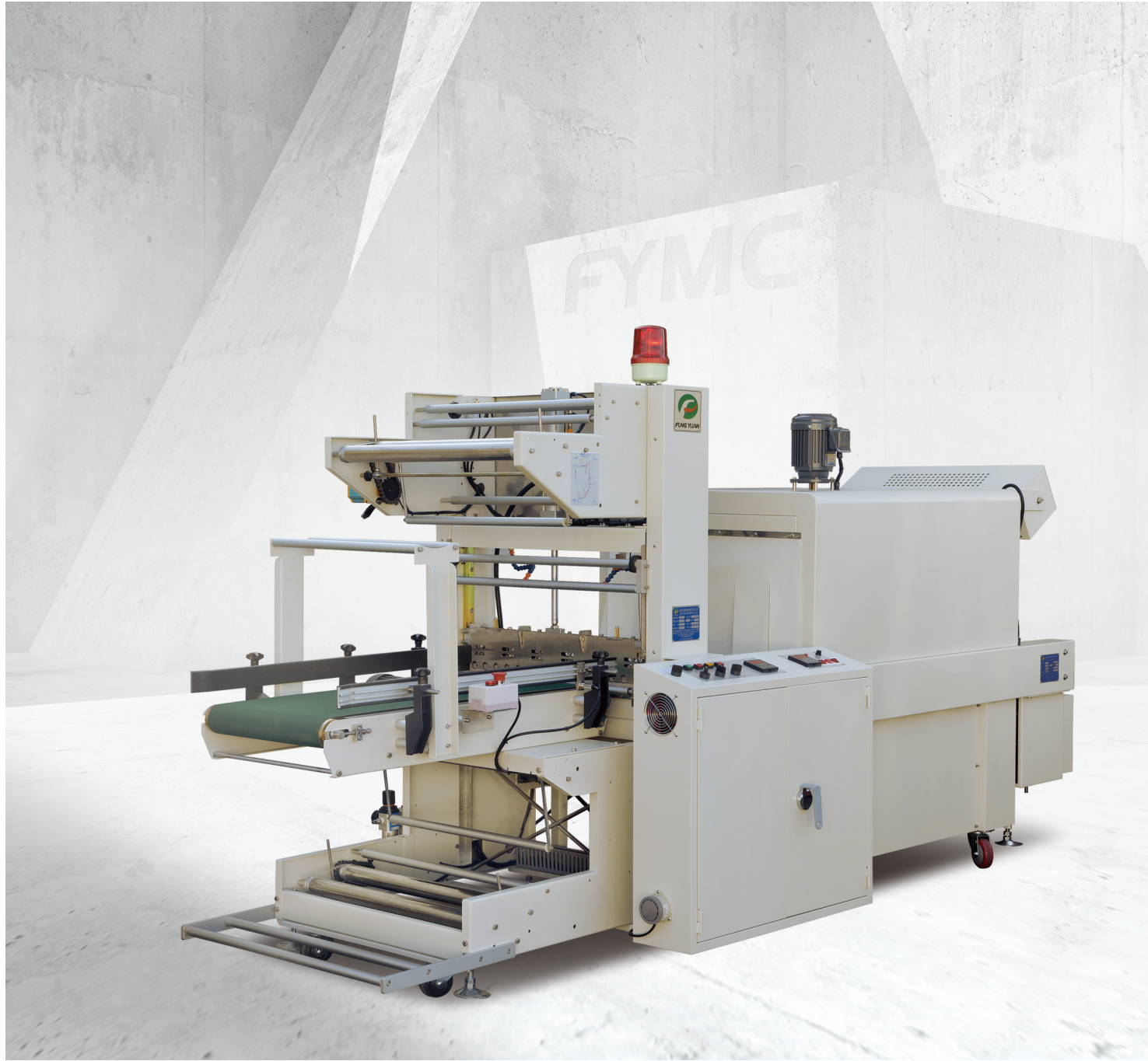
袖筒式兩面封口包裝方式，包裝產能約 5~18 包 / 分。