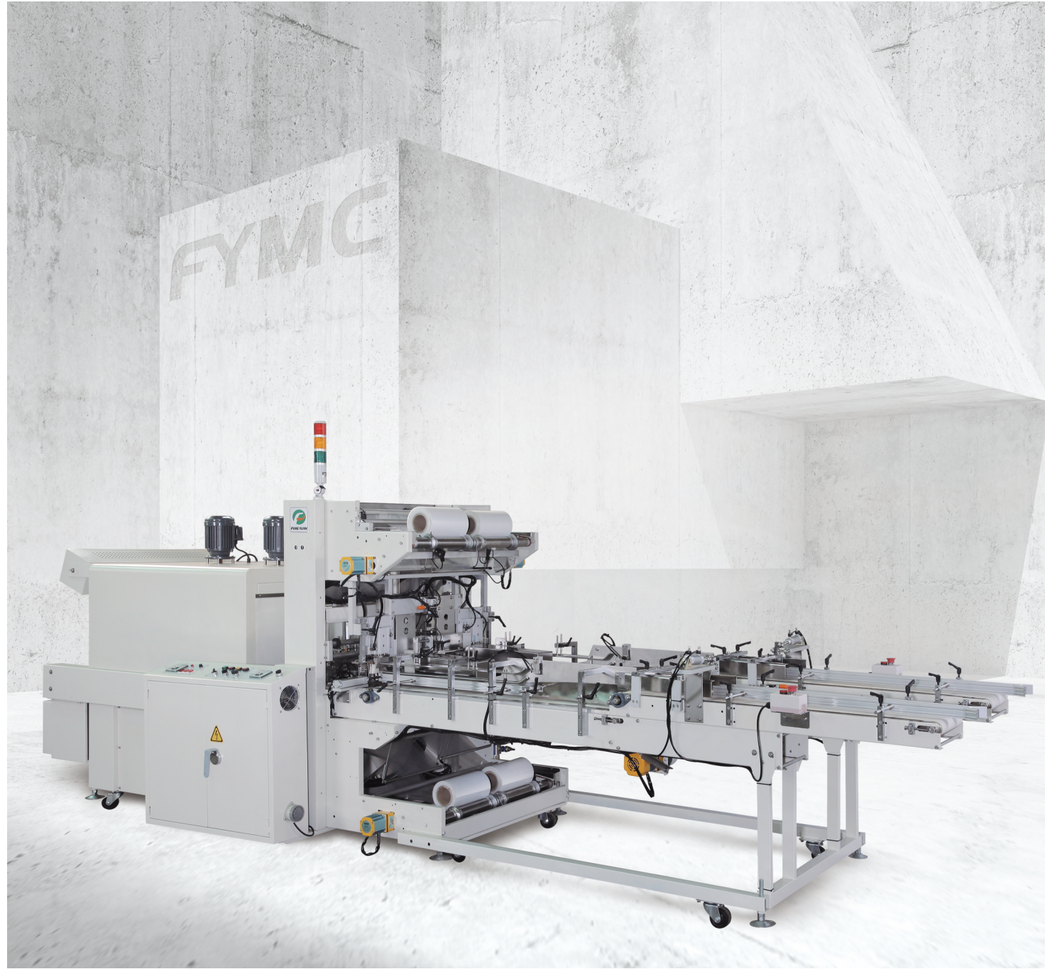
■ 袖筒式兩面封口包裝方式，包裝產能約 14~26 包 /分 (雙包出料)。